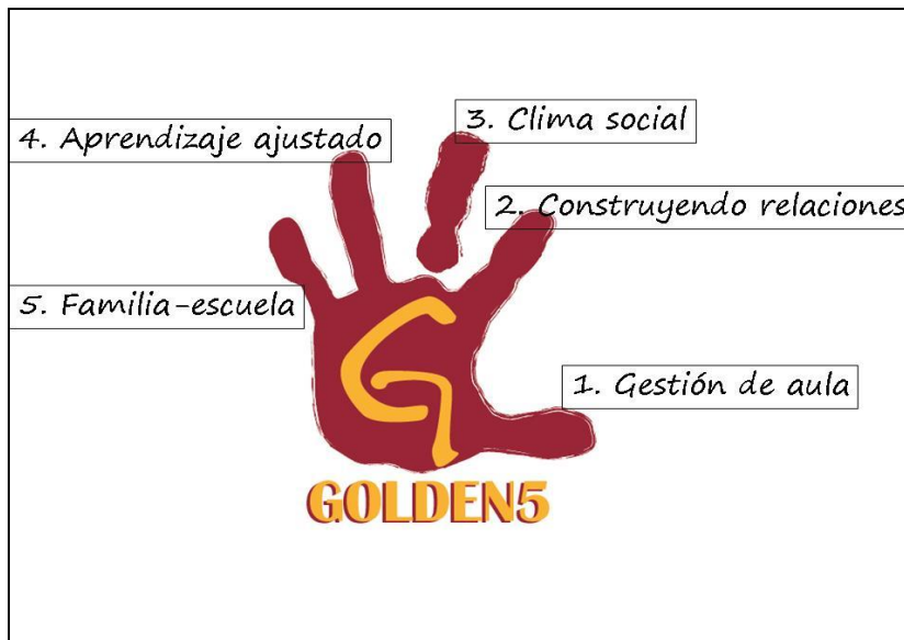
Ilustración 2.- Áreas Golden

El programa Golden5 se estructura en cinco áreas, llamadas áreas Golden y que consideramos necesarias y relevantes para que el profesorado pueda cambiar su aula, y ayudar al alumnado que más lo necesite (ver cuadro 2).